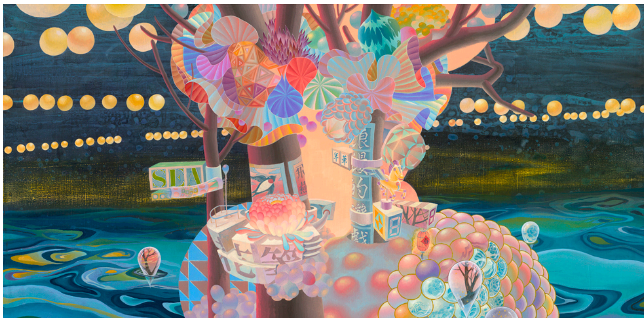
"Popular Fiction", 黃柏勳, 圓創藝術, 台灣, 房間 4317