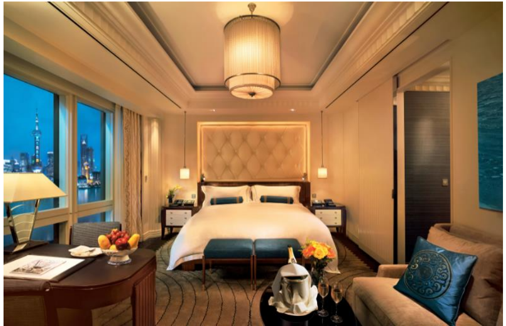
上海半岛酒店的豪华江景客房，俯瞰旖旎的黄浦江美景和靓丽的浦东天际线。优雅的欧式元素与中式图腾旨在致敬上海被誉为“东方巴黎”的法租界时期。