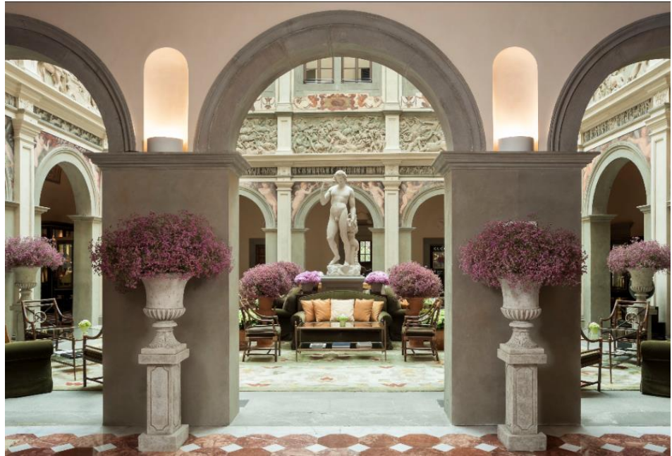
佛罗伦萨四季酒店的庭院式大堂，坐拥绝佳采光，精致的浮雕图案随处可见。