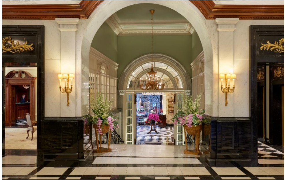
透过伦敦萨沃耶酒店大堂可窥见酒店的中心区，由此可通往酒店的巧克力商店、茶室、餐厅及酒吧。