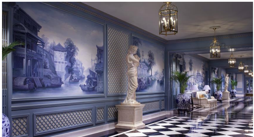
天津丽思卡尔顿酒店的每一处空间都经过了精心的设计；走廊一侧挂有当地工匠手绘的壁画作品。