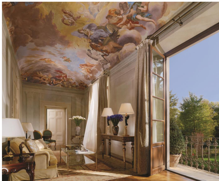
佛罗伦萨四季酒店的总统套房，每间套房均独具特色，设计灵感来源于经过修复后的壁画、原创艺术品和葱茏花园景致所具有的缤纷色彩。