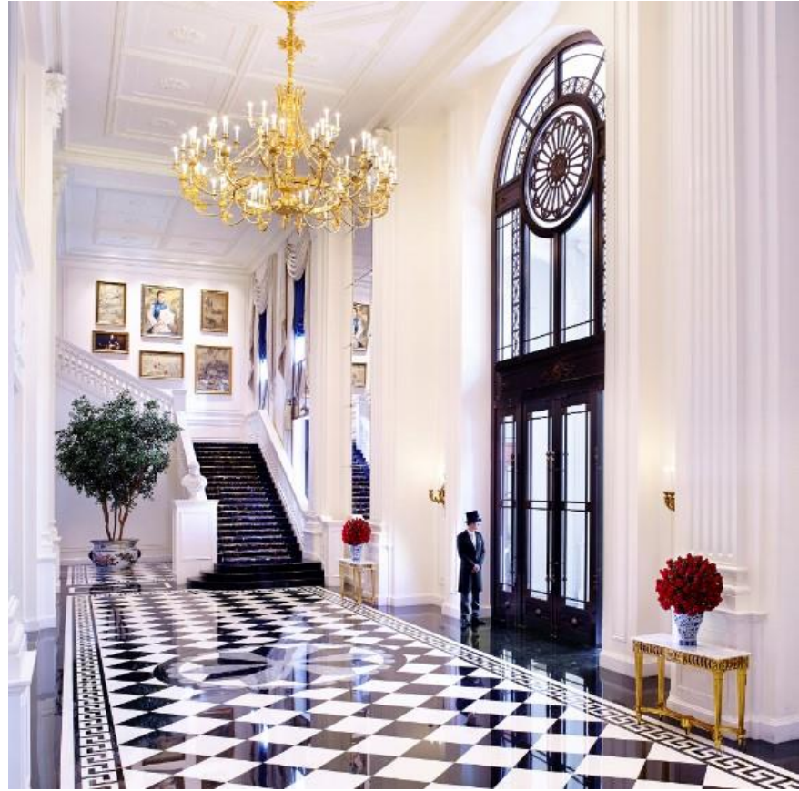
天津丽思卡尔顿酒店大堂，主打英国新古典主义时期的对称、平衡设计风格，入口两侧设有科林斯式圆柱和大楼梯。