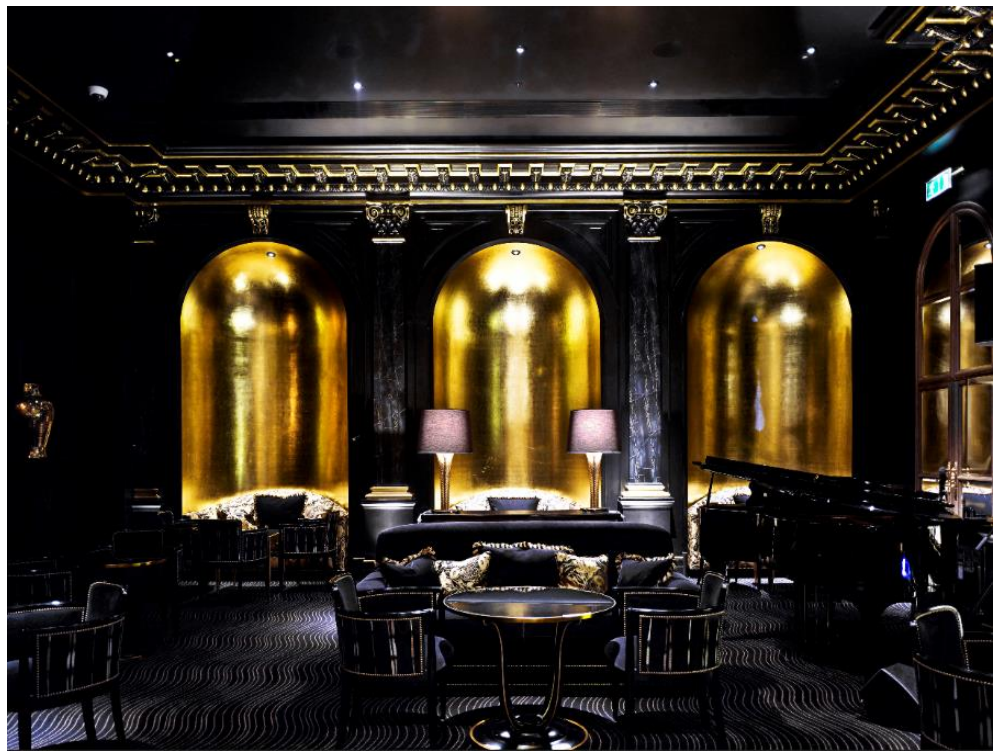
薩沃耶酒店 Beaufort 酒吧內的 High drama——以愛德華七世時代的經典巴羅克元素為背景，裝飾派藝術風格的圖騰和色彩實現了和諧互融，其由酒店始於 20 世紀二三十年代的卡巴萊演出舞臺改建而成。